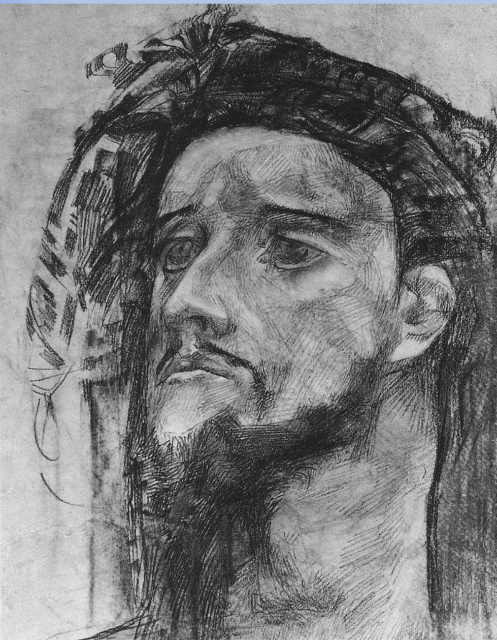
Врубель. Голова пророка

«А не должен ли он стать пророком любви к ближнему?» (А.О. Одоевский)